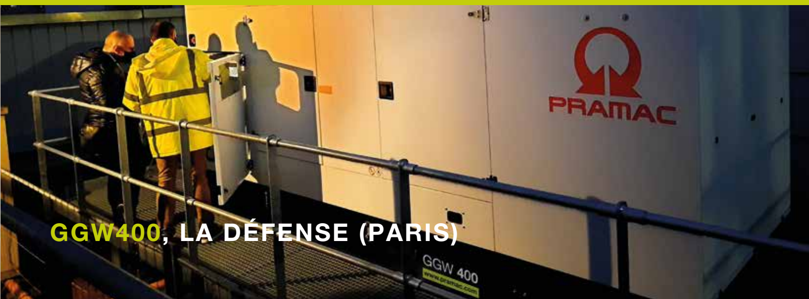
GGW400, LA DÉFENSE (PARIS)

** Les données se réfèrent aux produits destinés aux marchés non européens .